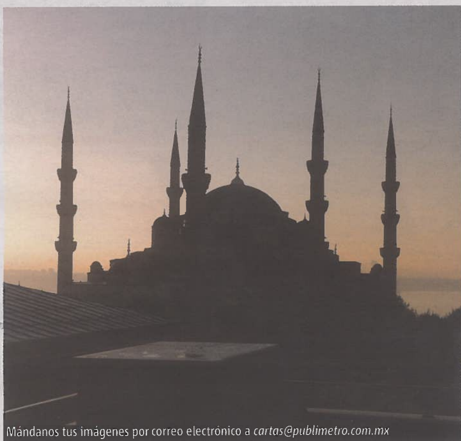
Mándanos tus imágenes por correo electrónico a cartas@publimetro.com.mx